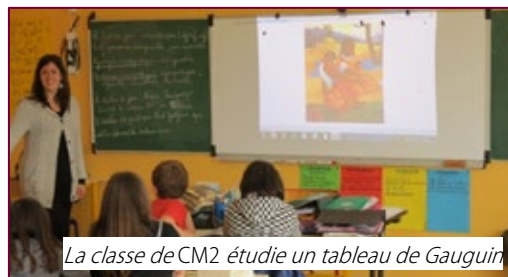
La classe de CM2 étudie un tableau de Gauguin

élémentaire d'un vidéo projecteur interactif et d'un micro-ordinateur. Ces nouveaux équipements, combinés avec le traditionnel tableau noir légèrement modifié pour l'occasion, ont permis l'accès à toutes les fonctionnalités d'un véritable tableau numérique interactif. Une connexion internet dans toutes les classes ouvre désormais à chaque enseignant un