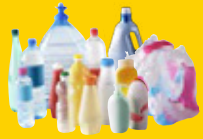
Bouteilles, bidons, flacons et sacs en plastique et films de suremballage