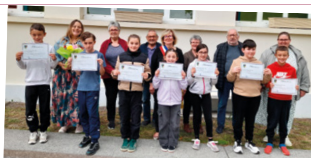
Les CM2 tournent une page et vont aborder le collège. La municipalité les honore et les félicite