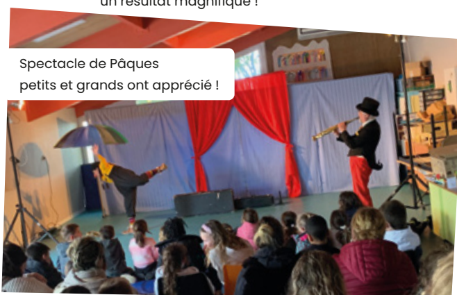
Spectacle de Pâques petits et grands ont apprécié !