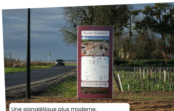
Une signalétique plus moderne, une autre façon de valoriser notre territoire