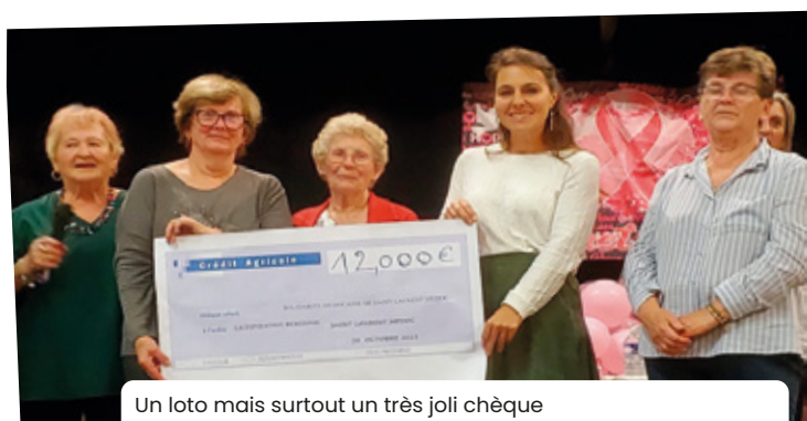
Un loto mais surtout un très joli chèque remis à l'Institut Bergonié. St Estèphe, terre solidaire !