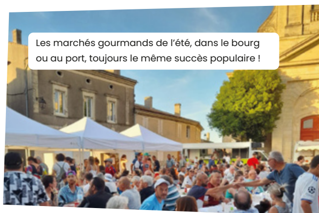
Les marchés gourmands de l'été, dans le bourg ou au port, toujours le même succès populaire !