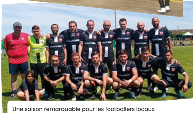
Une saison remarquable pour les footballeurs locaux. Accession, travaux au stade municipal... De quoi envisager l'avenir de cette entente St Seurin-St Estèphe avec optimisme !