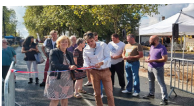
La Foire de la Chapelle, une très sympathique tradition !