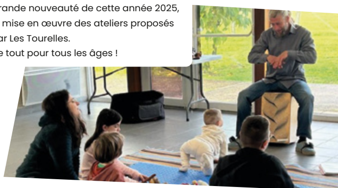
Grande nouveauté de cette année 2025, la mise en œuvre des ateliers proposés par Les Tourelles. De tout pour tous les âges !