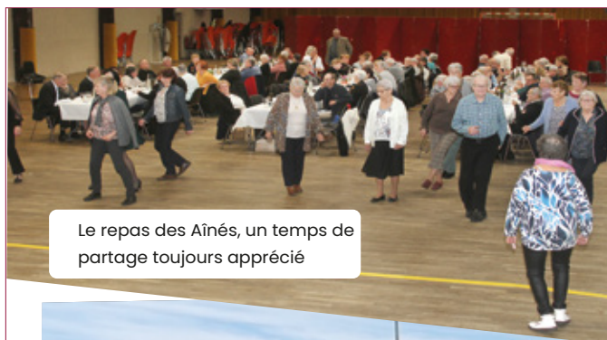
Le repas des Aînés, un temps de partage toujours apprécié